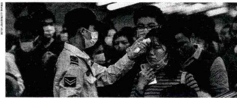
Fundadora checa a temperatura de mulheres na entrada de um metrô em Pequim, China.

Atualmente, 6.965 casos de coronavírus foram confirmados em todo mundo, sendo 5.997 somente na China, onde 132 pessoas já morreram. Não houve ainda nenhuma morte em outros países.