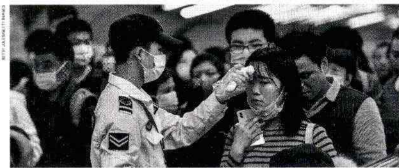
Fandominária checa a temperatura de mulheres na entrada de um metrô em Pequim, China

Atualmente, 6.965 casos de coronavírus foram confirmados em todo mundo, sendo 5.997 somente na China, onde 132 pessoas já morreram. Não houve ainda nenhuma morte em outros países.